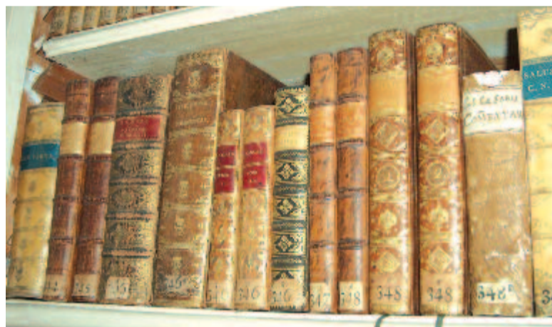
Ritka kötetek a könyvtár polcain

A Teleki Téka gyűjteménye a felvilágosodás hatása alatt formálódott. Teleki Sámuel a nagy francia enciklopédia két kiadása mellett megvásárolta a legjobb szaklexikonokat, megszerezte az európai tudományos társaságok, akadémiaik közlönyeit. A könyvek legnagyobb