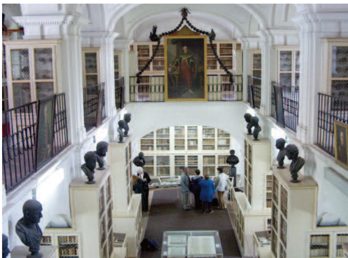
A könyvtár az alapítót ábrázoló egész alakos festménnyel

része latin, görög, német, francia és magyar nyelvű, de sok más európai és keleti nyelven írott mű is fellelhető a könyvtárban. Az alapító a kontinens huszonöt városából vásárolt, mintegy hat évtizedes rendszeres gyűjtőmunka során sikerült megszereznie az alapvető tudományos műveket, nemcsak kortárs kiadványokat, hanem a nyomtatás kezdetétől megjelent könyveket is. Teleki Sámuel bibliofil ritkaságokat is vásárolt. Kéziratok gyűjteményének legértékesebb darabja – egy corvina – sajnálatos módon elkerült az Egyesült Államokba a második világháborút megelőző években. Könyvtárának felbecsülhetetlen kincsei közé tartozik 52 ősnymtatvány, unikumok, ritka könyvek, első kiadások, díszkiadások. Régi híres nyomdászműhelyek mesterremei közül válogatott: az Aldus Manutius, Giunta, Estienne, Plantin, Elzevir, Frobenius, Bodoni, Heltai, Honterus, Tótfalusi Kis Miklós officinák sok-sok kiadványa emeli a gyűjtemény értékét, hírnevét. Különös műgonddal válogatta össze a görög és latin klasszikus szerzőknek a szövegűség, a kommentár és a nyomdai kivitelezés szempontjából a legjobb kiadásait. Sok kiadványt híres festők és grafikusok illusztráltak: Dürer, Rubens, ifj. Hans Holbein, Lucas Cranach, Bernard Picart. Jelentős azoknak a könyveknek a száma is, melyek az