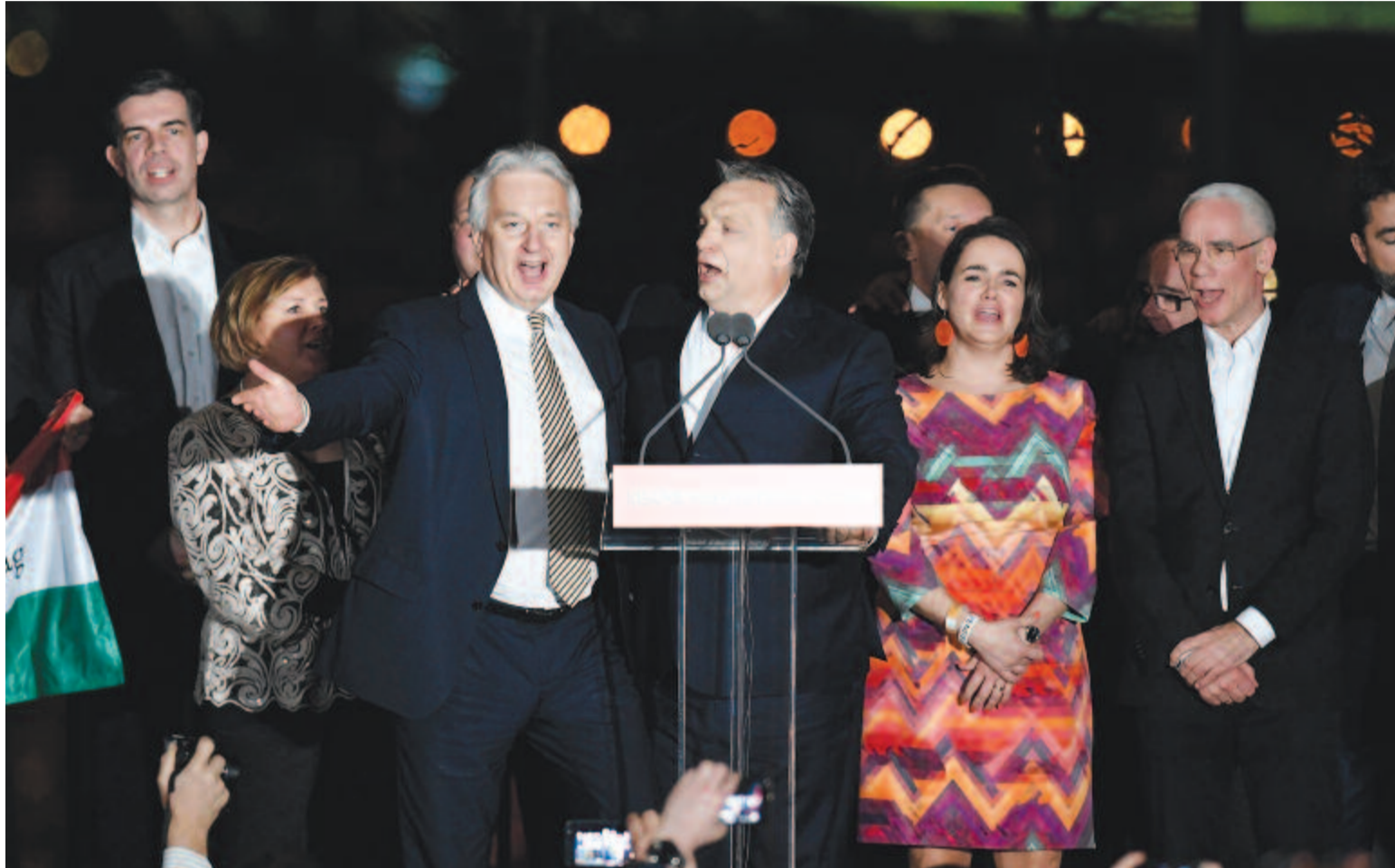
A Fidesz és a KDNP vezető politikusai a Bálna előtt összegyűlt emberekkel elénekelték a Kossuth-nótát, ezt követően pedig a Himnusz