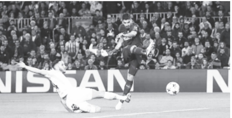
Luis Suárez lötte a Barca negyedik gólját.